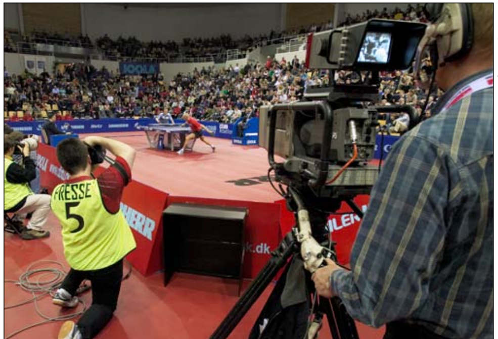
Et relativt sjældent syn: En mindre idrætsgren har tv's bevågenhed. Fra EM i bordtennis i Århus.