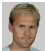
Af Martin Hedal, Idrættens Analyseinstitut

Kommentar: Idrætten og tv-stationerne kan skabe et varieret og spændende udbud af levende billeder med sportsindhold, hvis innovation og en bredere opfattelse af sport på tv kommer på dagsordenen.